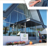
ゆめちからテラス 〒069-0832 北海道江別市西野幌107-1 https://www.yumechikara-terrace.jp