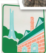
江別市 Ebetsu City