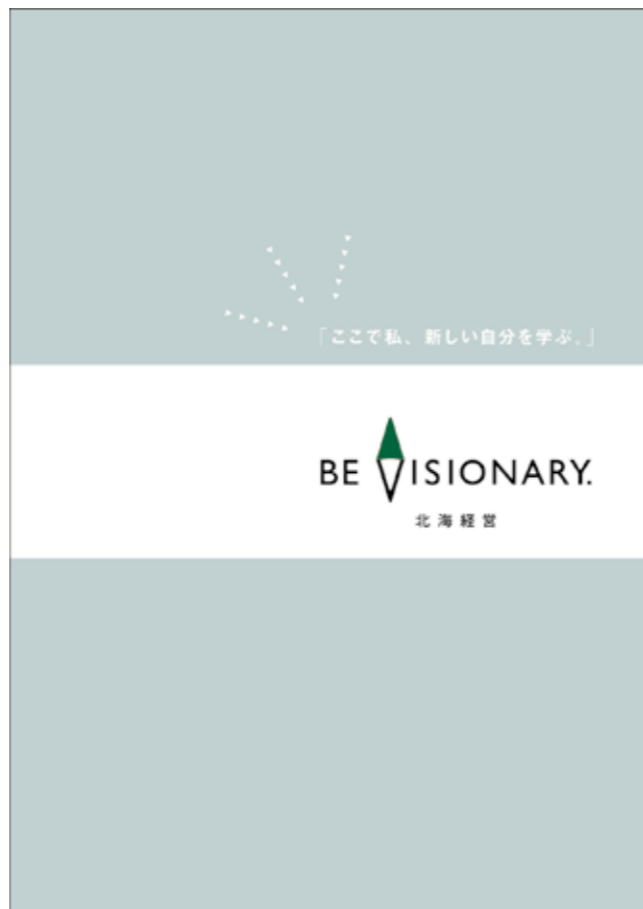
12-1. アカデミックリテラシー 表 1