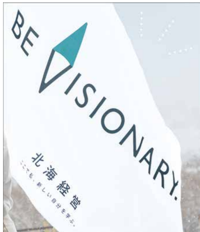
13-1. 学校紹介パンフレット